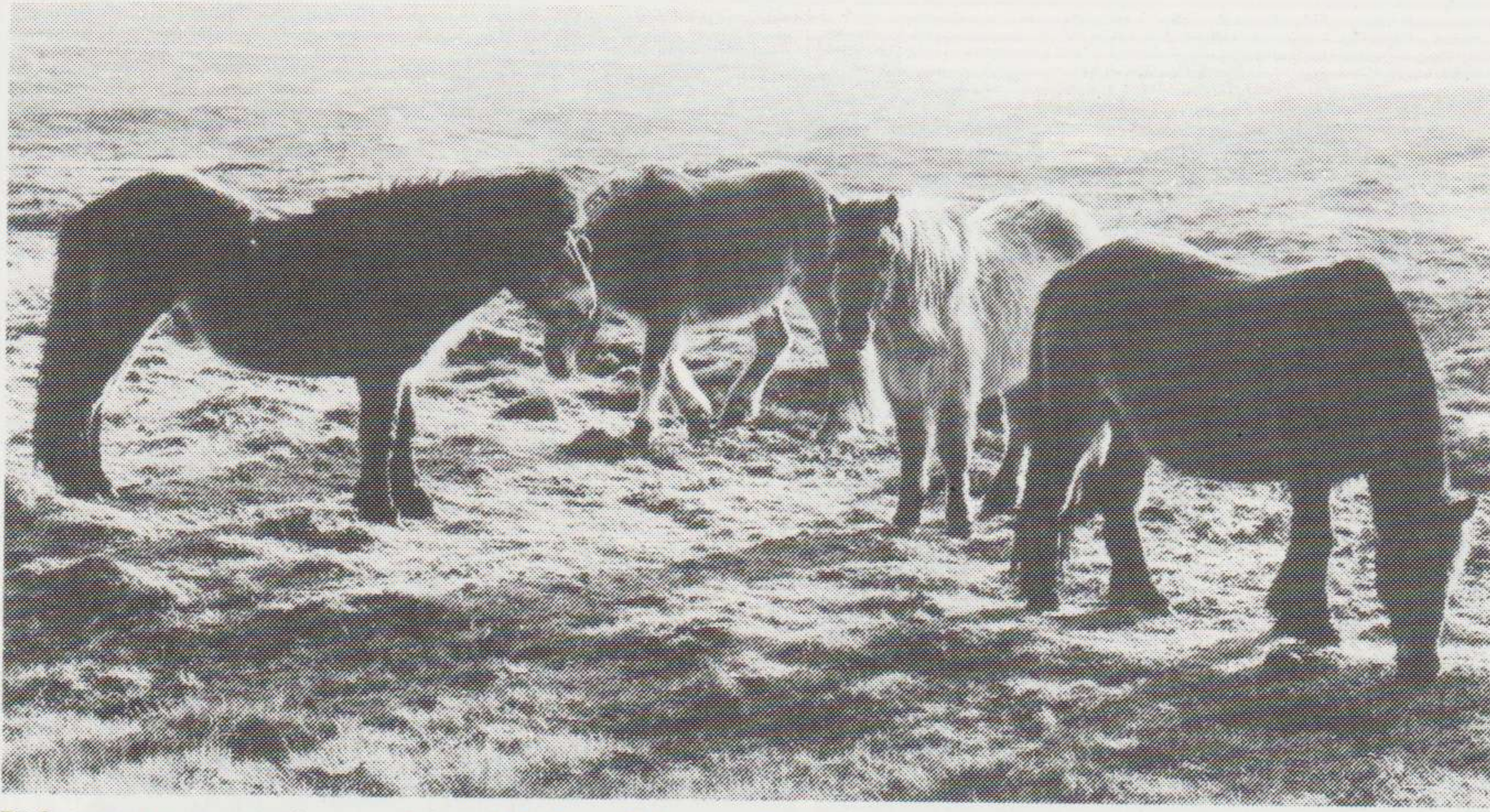
Vágarross næst føroysku rótini.

landinum, og hartil bleiv búnaðarráðgevarin (landbrugskonsulenten) biðin um á sínum ferðum um landið árið eftir — 1901 — at velja út tvær ryssur og ein hest av teimum bestu, hann kundi finna, og vissa teimum